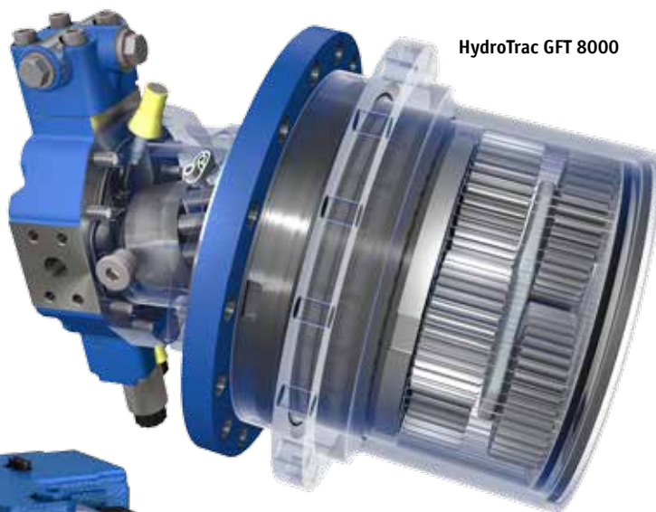
HydroTrac GFT 8000

Результат обычно не заставляет себя ждать: много путаницы, низкая производительность, а в некоторых случаях это приводит к катастрофическим неудачам, требующим значительных средств, чтобы устранить нанесенный ущерб. Тем не менее на рынок выходят все новые игроки, правда им трудно конкурировать с международными поставщиками с точки зрения качества, характеристик, функциональных возможностей и уровня сервиса.